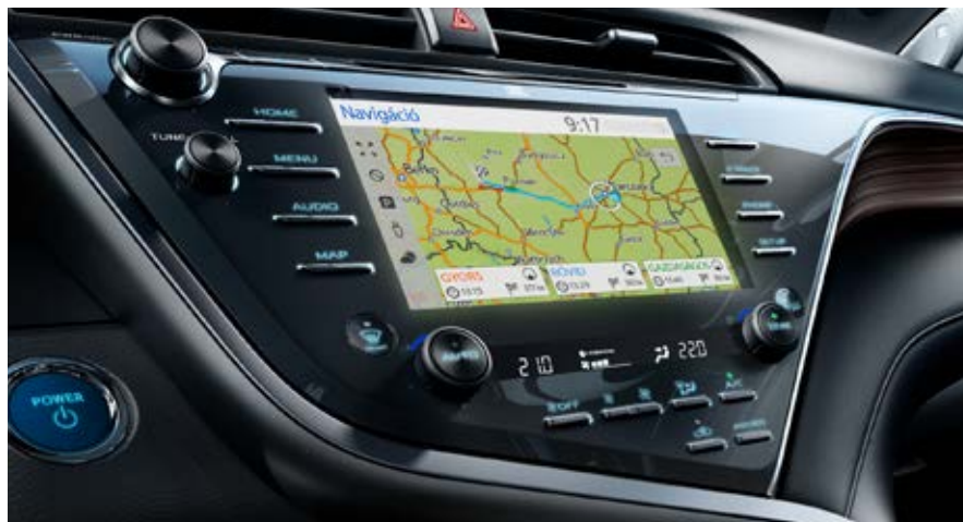
A Toyota Touch® 2 médiarendszer 8 colos színes érintőképernyőjén kezelheti a navigációt, az audiorendszert és az alkalmazásokat.