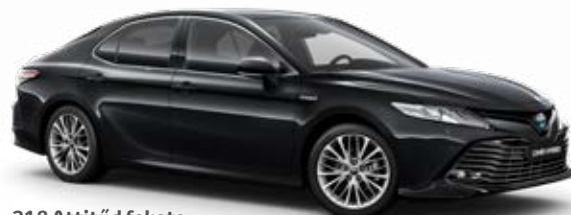
218 Attitűd fekete metálfényezés