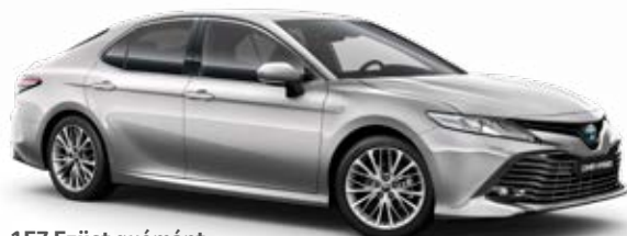
1F7 Ezüst gyémánt metálfényezés