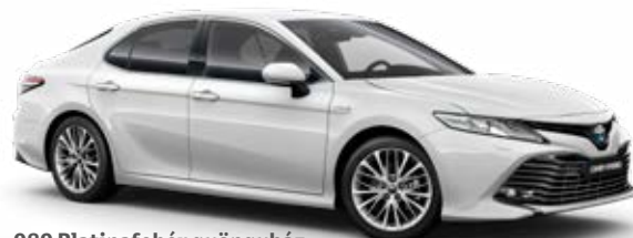
089 Platinafehér gyöngyház gyöngyházfényezés