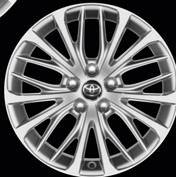
18" könnyűfém keréktárcsák 235/45 R18 méretű gumiabroncsokkal Alapfelszereltség a Prestige és az Executive modellváltozatoknál