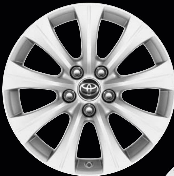
17" könnyűfém keréktárcsák 215/55 R17 méretű gumiabroncsokkal Alapfelszereltség a Comfort modellváltozatnál