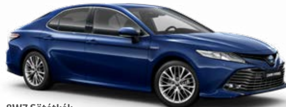
8W7 Sötétkék metálfényezés

Az egyes fényezések elérhetősége a kiválasztott felszereltségi szinttől is függhet.