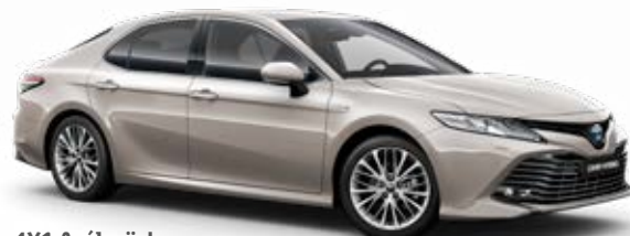
4X1 Acélszürke metálfényezés