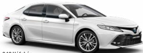
040 Hófehér alapszín