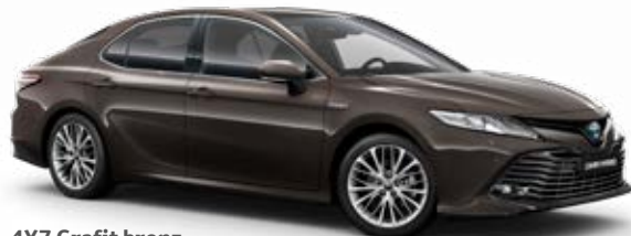
4X7 Grafit bronz metálfényezés