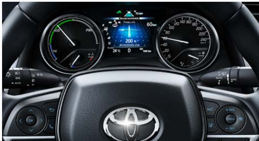
A 7" színes érintőképernyőn tisztán leolvashatók a legfontosabb információk.