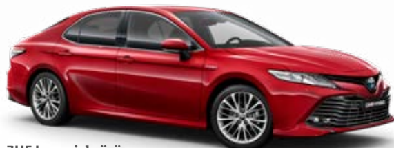
3U5 Imperial vörös speciális fényezés