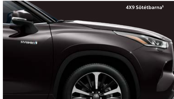
4X9 Sötétbarna §