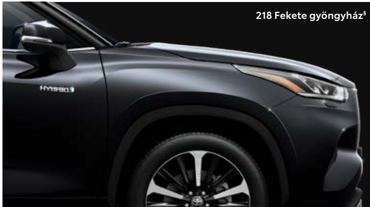
218 Fekete gyöngyház §