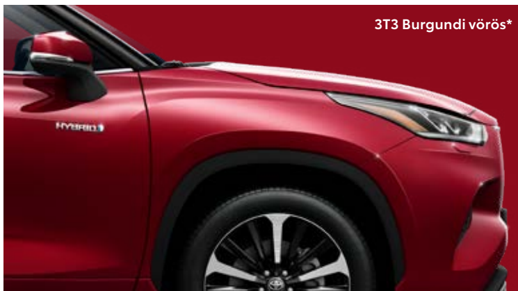
3T3 Burgundi vörös* §