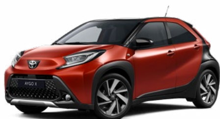
2VH Chilivörös fekete tetővel Felár nélkül Prémium fényezés Elérhető a Style és Executive felszereltségnél