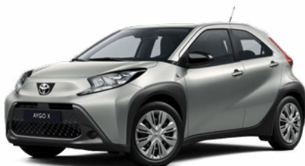
1L0 Prémium ezüst* 130 000 Ft Elérhető az Active és Comfort felszereltségnél