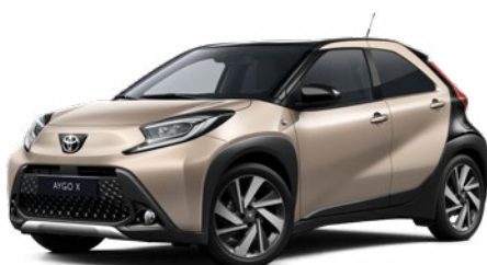
2VJ Gyömbér bézs fekete tetővel Felár nélkül Prémium fényezés Elérhető a Style és Executive felszereltségnél