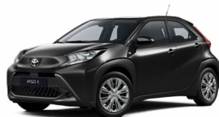
209 Éjfeke* 130 000 Ft Elérhető az Active és Comfort felszereltségnél