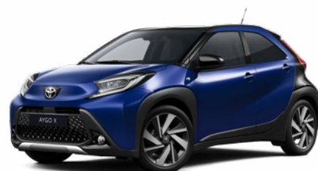
2VL Boróka kék fekete tetővel Felár nélkül Prémium fényezés Elérhető a Style és Executive felszereltségnél