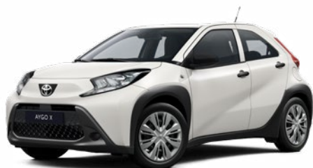
040 Hófehér Felár nélkül Elérhető az Active és Comfort felszereltségnél