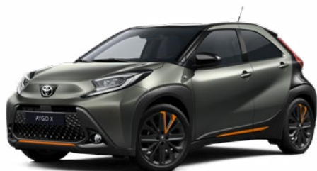
2VK Kardamom zöld fekete tetővel Felár nélkül Prémium fényezés Elérhető a Style és Executive felszereltségnél